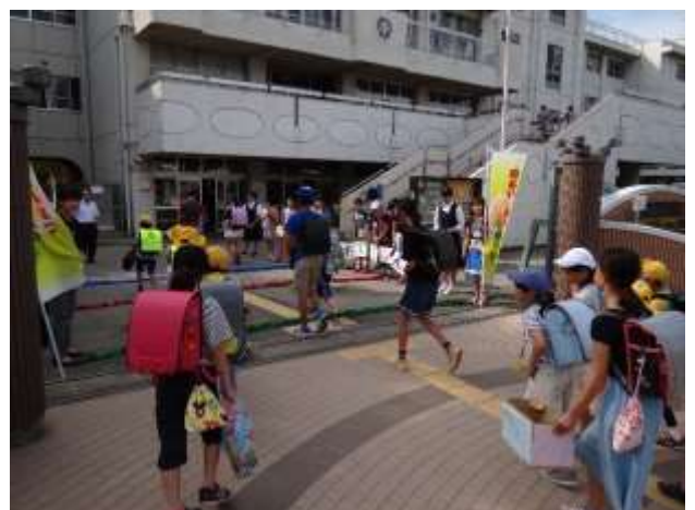
あいさつ運動・土合中学校と合同で

7月に入って、地域の夏祭りもありました。神輿や金管パレードなども貴重な経験です。夏休みに入ってから、恒例の中島盆踊りがあります。様々な楽しいイベントが、子どもたちにとって故郷の大切な思い出になるよう、どうぞよろしくお願いたします。